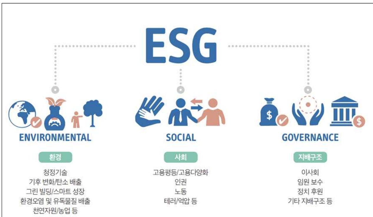
그림 1-1 ESG의 개념