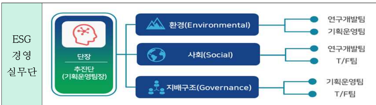
그림 III- ESG 경영실무단