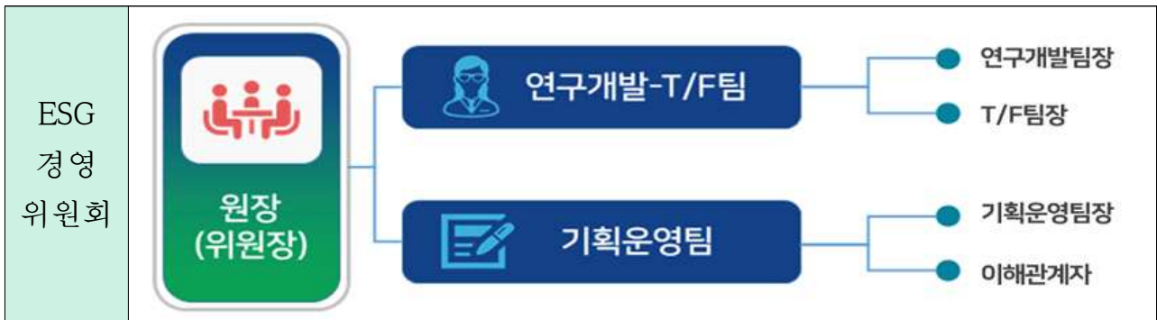
그림 III-3 ESG 경영위원회