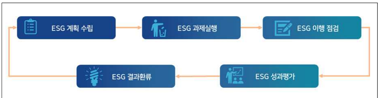
그림Ⅲ-1 ESG 경영 추진체계